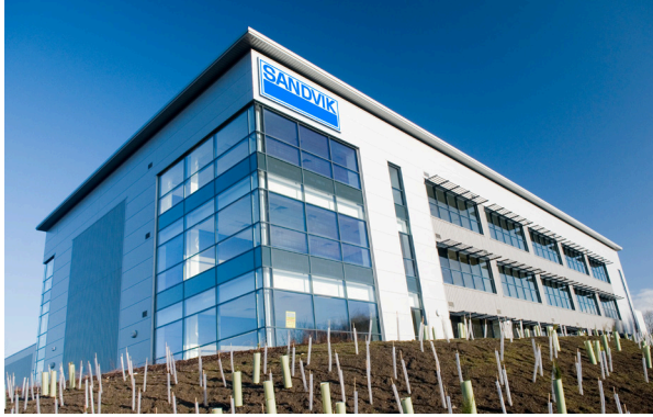
Sandvik Medical Solutions 公司，位於英國謝菲爾德市 (Sheffield)